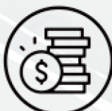
Tabela de descontos progressivos por total de colaboradores no sistema